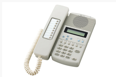
IPインカム IP多機能端末