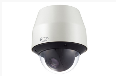
屋外フルHDネットワークPTZカメラ