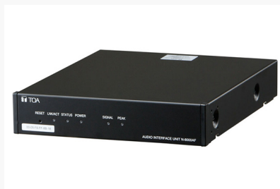
IPインカム 音声I/Fユニット