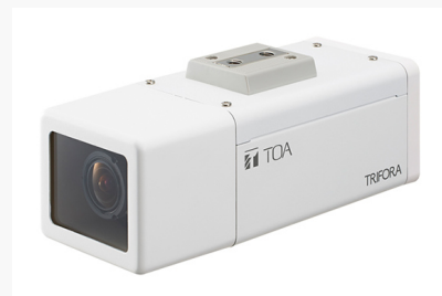
フルHDネットワークカメラ