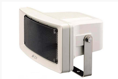
ワイドホーンスピーカー 15W